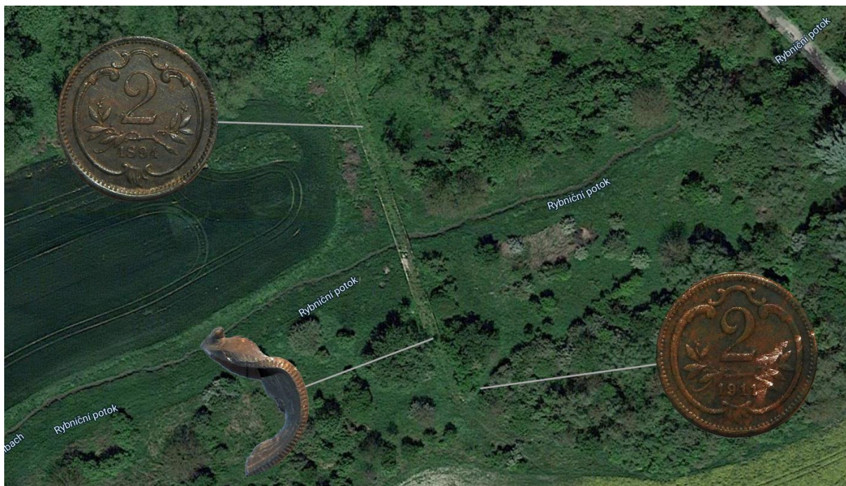
Obr. 11. Poloha mincí.