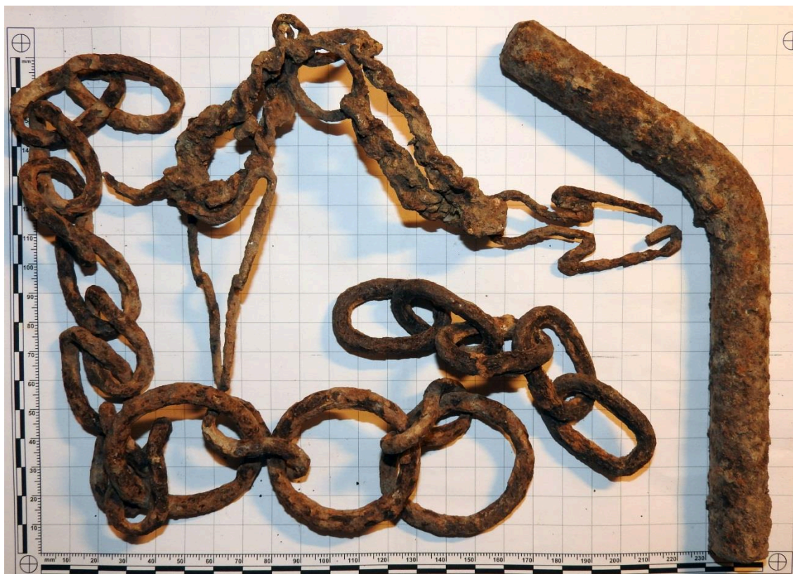
Obr. 7. Zbytky po zemědělské/lesnické činnosti - řetězy, závlačka.