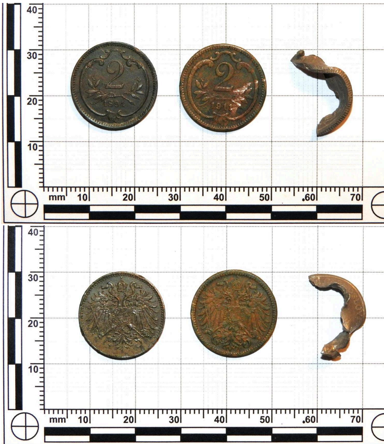
Obr. 3. Mince z prostoru mostu.