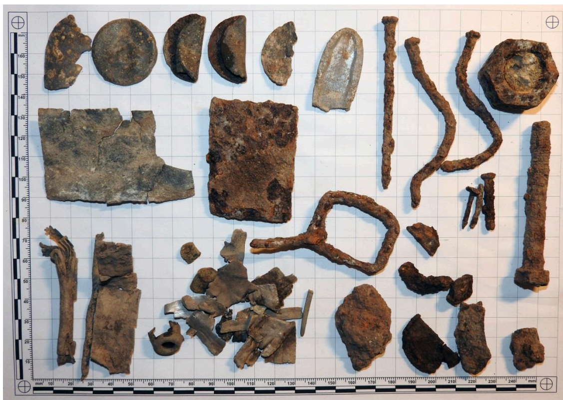
Obr. 5. Odpad – železo, hliník, zinek.