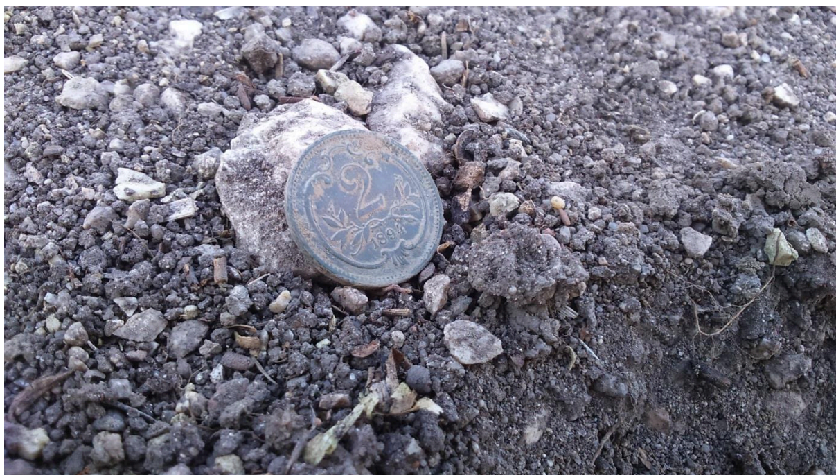
Obr. 10. Dvojhalěž 1894, Rakousko-Uhersko. Nálezový stav.