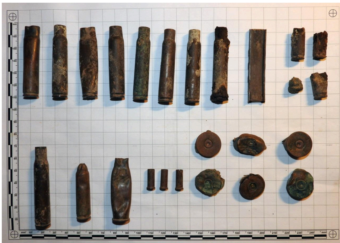
Obr. 4. Zbrojní odpad – nábojnice, kapsle, nábojový pásek.