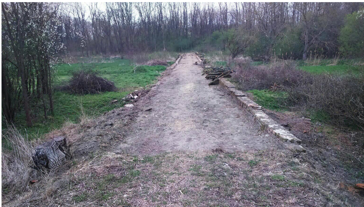
Obr. 9. Stav skrývky povrchu mostu 15. 4. 2019.