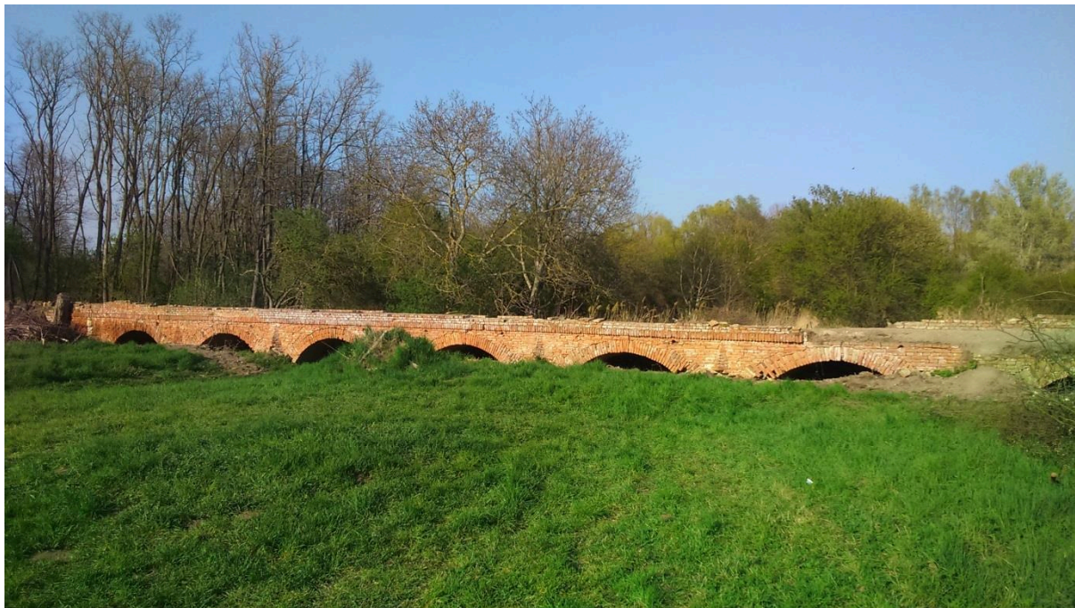
Obr. 8. Cihlový most přes původní část Nového rybníka (Portz).