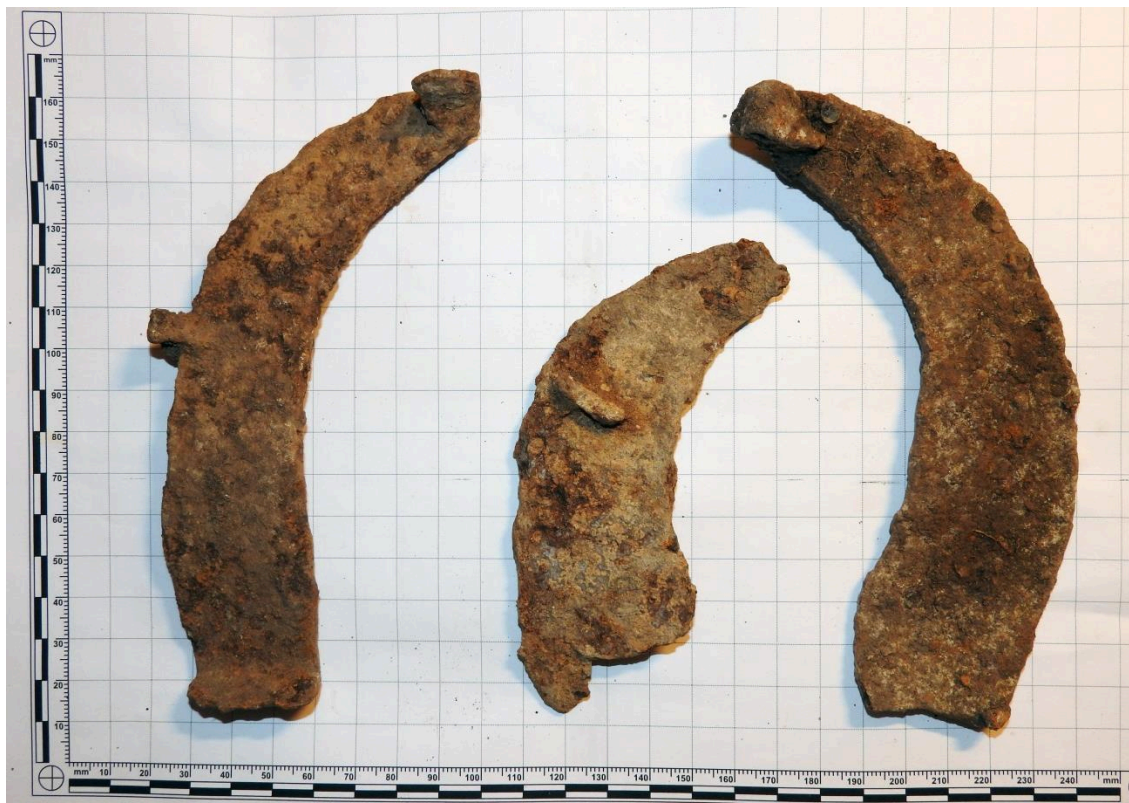
Obr. 6. Železné podkovy.